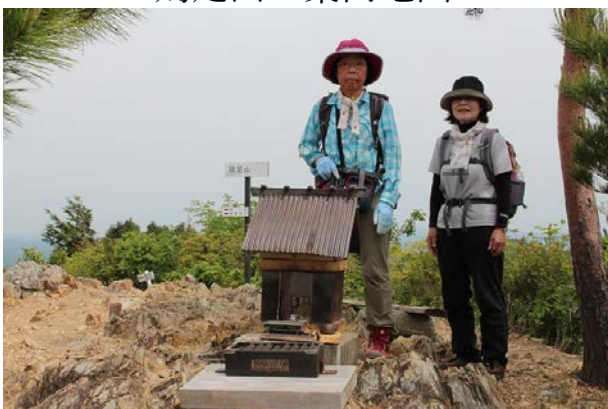
旧（本当の）鶏足山山頂