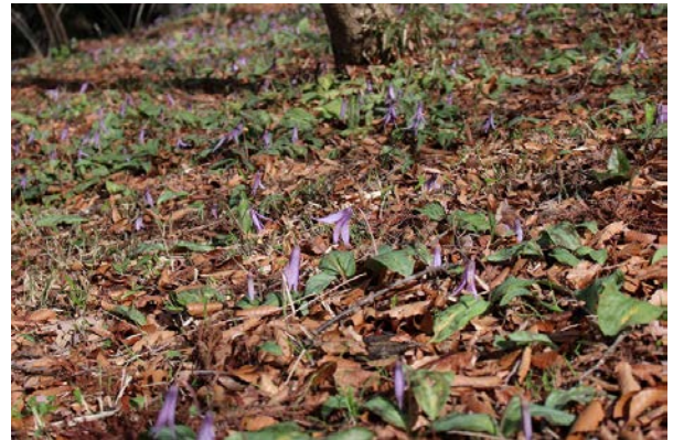
カタクリは夜の雨で開いていない