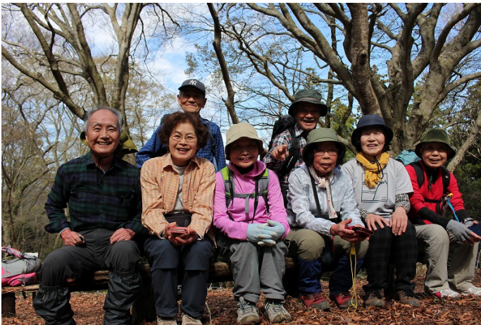
吾国山での記念写真