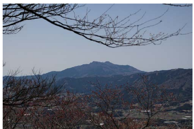
難台山から見た筑波山