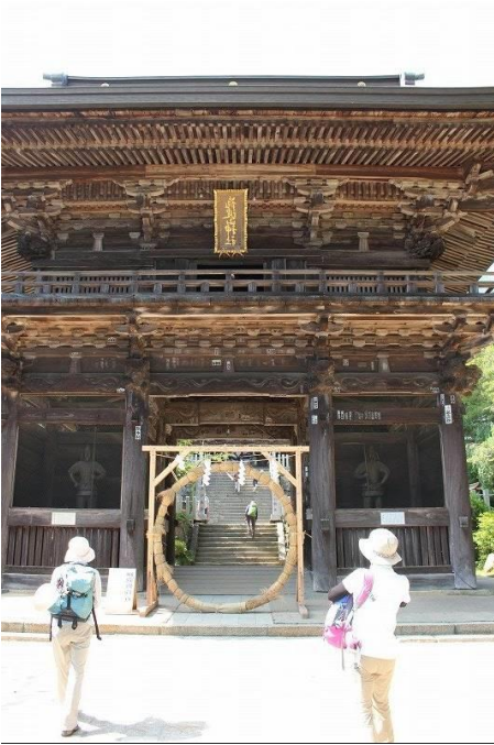
筑波神社山門の儀式